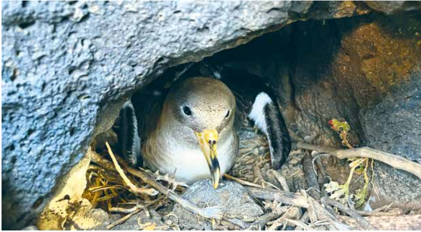
Sepiasturmtaucher in einer Felsnische. Weit verbreitete Schadstoffe wie Quecksilber und Ewigkeitschemikalien beeinträchtigen den Energiehaushalt der Vögel.