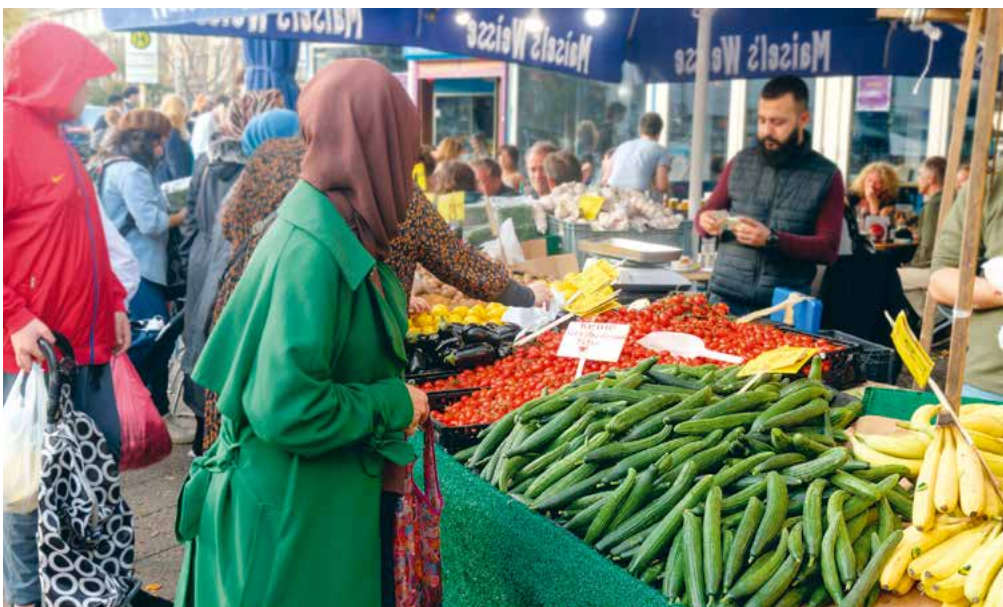
Der Markt am Maybachufer in Berlin-Kreuzberg, ein Ort, an dem sich Menschen unterschiedlicher Herkunft begegnen.