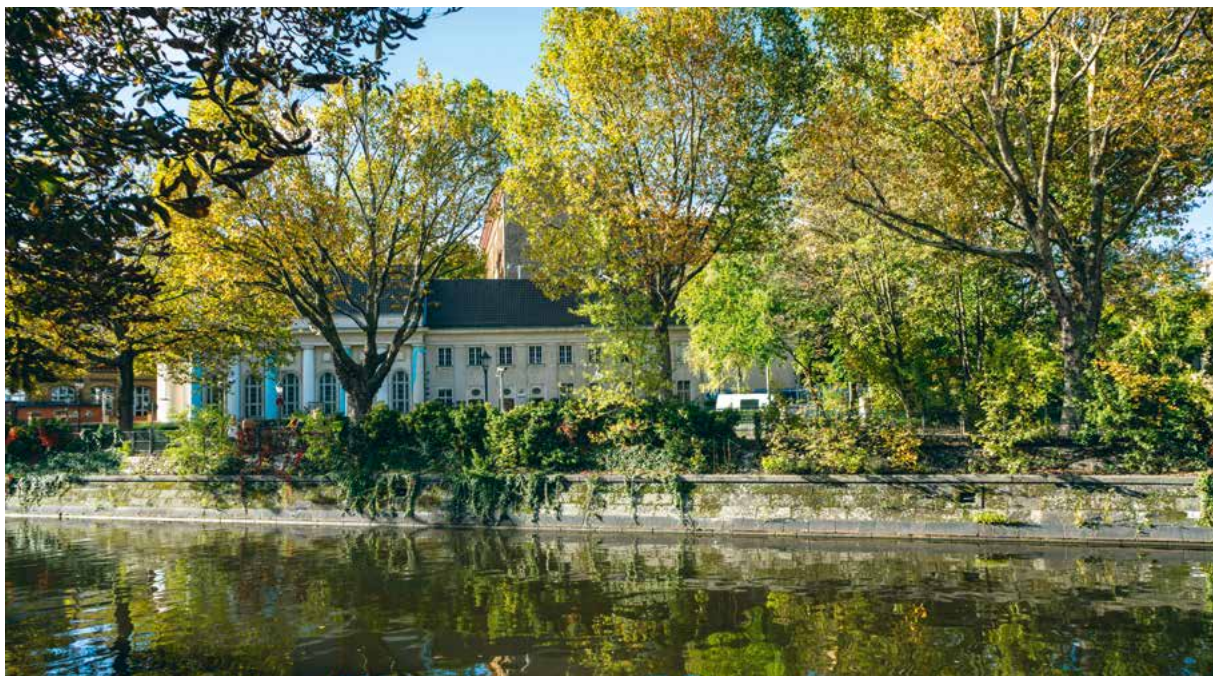
Die Synagoge am Fraenkelufer in Berlin-Kreuzberg. Sie ist ein Anlaufpunkt für Jüdinnen und Juden, die aus Israel, den USA, aus Lateinamerika nach Berlin ziehen.