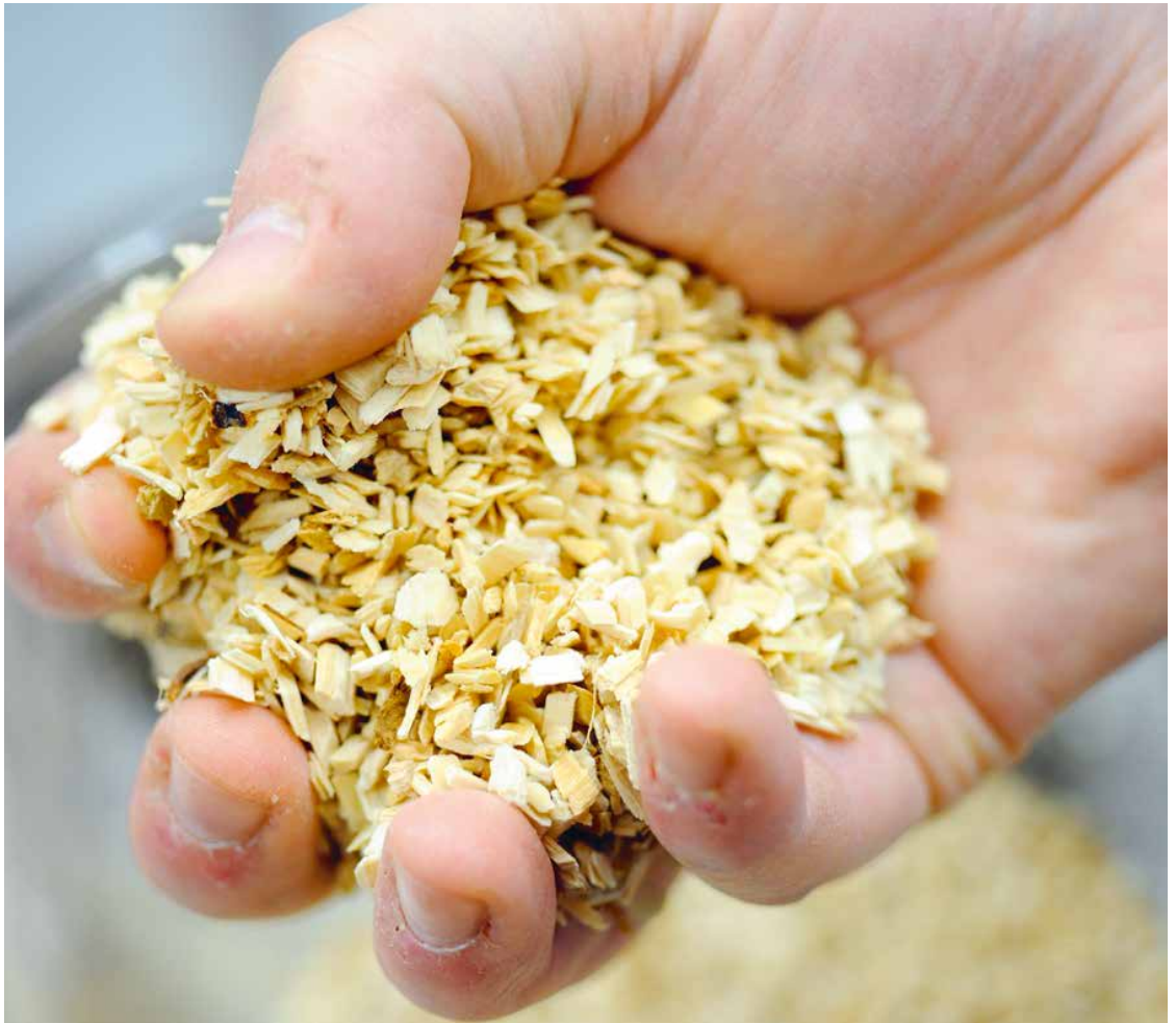
Rohstoff Sägespäne: Holz besteht im Wesentlichen aus Lignocellulose, aus der sich sowohl Biosprit als auch Ausgangsstoffe für die chemische Industrie gewinnen lassen.

Dabei haben es die Forscher darauf abgesehen, möglichst viele Bestandteile der Biomasse zu nutzen. Im Fokus steht dabei die Lignocellulose, die aus Cellulose, Hemicellulose und Lignin besteht und das Gerüst von Pflanzen bildet. Mit ihren hohen Anteilen an Kohlen- und Wasserstoff ist sie ein attraktiver Rohstoff für Alternativen zu Benzin und Diesel, die nichts anderes sind als Kohlenwasserstoffe. Aus ihnen lassen sich aber auch Substanzen gewinnen, aus denen chemische Erzeugnisse wie Kunststoffe hergestellt werden können. Für beide Anwendungen kommen als Ausgangsmaterial etwa Stroh oder die Abfälle von Baumpflegearbeiten infrage. Allein mit der in Deutschland jährlich anfallenden Strohmenge ließen sich theoretisch gut drei Prozent des heimischen Primärenergiebedarfs decken.