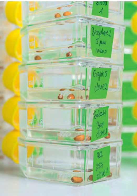
Die Riesenviren der Welt: In jedem Fläschchen schwimmen unzählige Einzeller und Viren aus unterschiedlichen Gewässern. Weizenkörner in den Fläschchen stimulieren das Wachstum von Bakterien, die wiederum Protisten als Nahrung dienen.

sogar mit Bakterien verwechselten. Im Wasserkreislauf eines Industriekühlturms in Bradford, Großbritannien, entdeckten 1992 Forscher den ersten Vertreter der viralen Giganten in einer Amöbe. Sie taufte das vermeintliche Bakterium zunächst Bradfordcoccus.