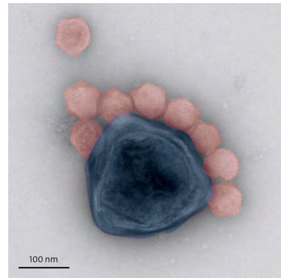
Partikel des Riesenvirus CroV (blau) und des Virophagen Mavirus (rot).

Im Fall von Mavirus ist das nur folgerichtig. Wenn es nämlich beim Einbau seines Erbguts nicht auf CroV angewiesen ist, kann es auch ohne das Riesenvirus von Zellgeneration zu Zellgeneration weitergegeben werden. „Da-