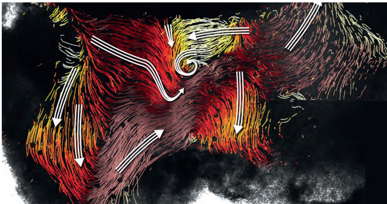
Grafik: Regina Faubel, Hartmut Sebesse / MPI für biophysikalische Chemie

Wandzellen der Ventrikel ihre Schlagrichtung und damit die Fließrichtung der Hirnflüssigkeit ändern können. Zu bestimmten Tageszeiten produzieren sie sogar Wirbel, die wie Barrieren wirken. Ob die Verteilung der Flüssigkeit und folglich die schlafauslösenden Neuropeptide tatsächlich einem zirkadianen Rhythmus folgen, steht noch nicht endgültig fest. Möglicherweise sind die Forscher mit ihrer Entdeckung einem völlig neuen Mechanismus auf der Spur, der nicht auf der Aktivität von Nervenzellen beruht, sondern rein auf der Aktivität der Wandzellen der Hirnventrikel.