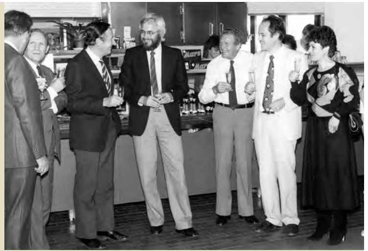
Ein Gläschen in Ehren: Georges Köhler (Mitte) und seine Institutskollegen stoßen auf den Nobelpreis an.

An jenem Tag setzte Köhler gegen 17 Uhr sein Experiment an. Bis mit einem Ergebnis zu rechnen war, würden vier oder fünf Stunden vergehen – genügend Zeit also, um zu Hause in Ruhe zu