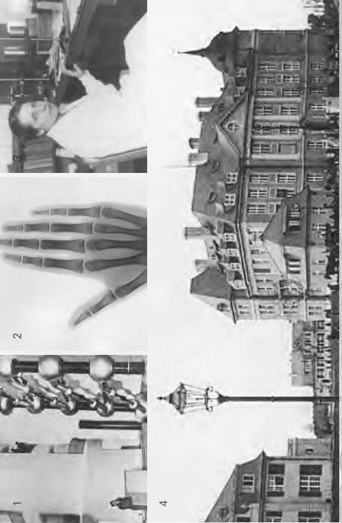
1. Kaiser-Wilhelm-Institut für Physik, Hochspannungsgenerator im „Turm der Blitze“, 1940er Jahre 2. Kaiser-Wilhelm-Institut für Anthropologie, Röntgenbild, 1930er Jahre 3. Lise Meitner, 1920er Jahre 4. Kaiser-Wilhelm-Institut für Chemie, um 1914

Die Kernspaltung, der erste Uranreaktor, das Elektronenmikroskop – erstaunlich viele wissenschaftliche Erkenntnisse und Erfindungen kommen aus Dahlem. Ab 1912 entwickelte sich das heutige Villenviertel zu einem Mekka für kreative Denker aus aller Welt. Einmalig in Deutschland, entstand hier der erste moderne Forschungscampus auf der Grünen Wiese. Unter den Dahlemer Forschern waren Albert Einstein, Otto Hahn und Lise Meitner. Den Impuls gab die Kaiser-Wilhelm-Gesellschaft, Vorläuferin der Max-Planck-Gesellschaft, die die Tradition zusammen mit der Freien Universität heute weiterführt.