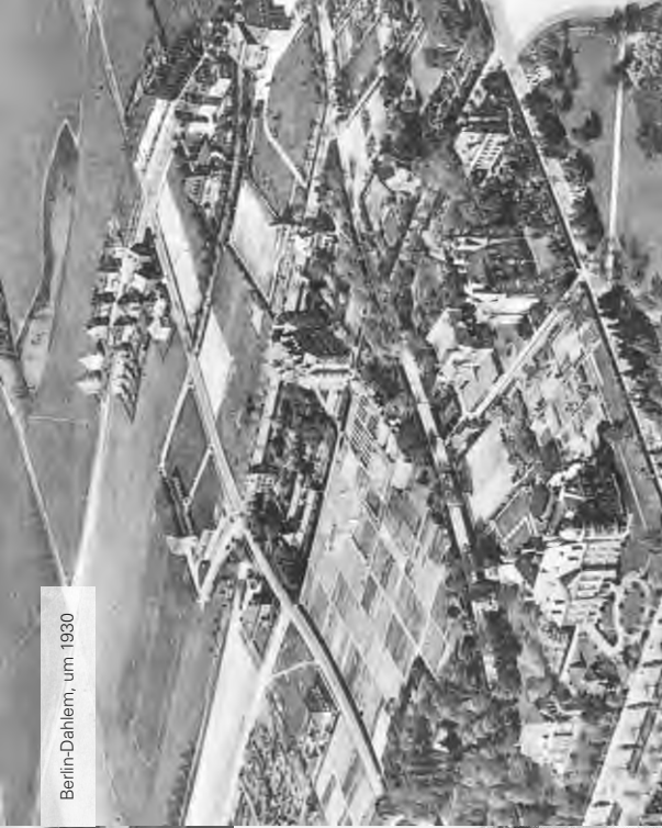
Berlin-Dahlem, um 1930

Beider Übersichtsführung können nach individueller Absprache Schwerpunkt zur Geschichte der Biologie, Physik und Chemie gesetzt werden. Darüber hinaus bieten wir vier Themenführungen an. Alle Rundgänge sind buchbar für Gruppen. Von April bis Oktober findet außerdem an jedem ersten Sonntag im Monat um 11 Uhr eine offene Führung für Einzelbesucher statt. Treffpunkt: Harnack-Haus, Ihnestr. 16-20, Kosten: 5€, 3€ ermäßigt.