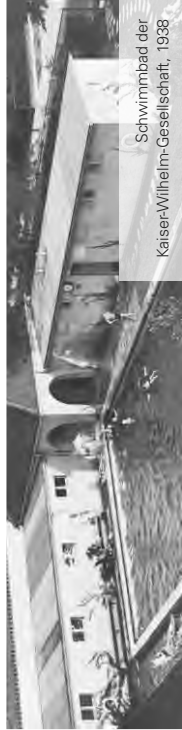
Schwimmbad der Kaiser-Wilhelm-Gesellschaft, 1938

Die klassische Übersichtstour zur Geschichte des Campus Dahlem von 1911 bis in die 1960er Jahre in unterschiedlichen Facetten.