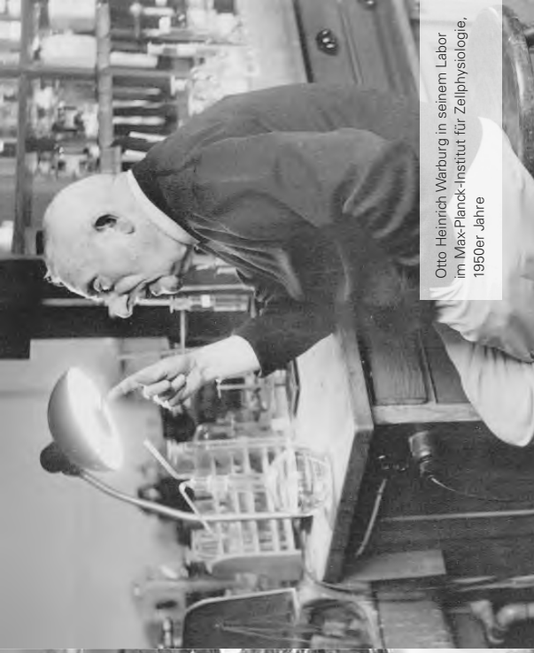
Otto Heinrich Warburg in seinem Labor im Max-Planck-Institut für Zellphysiologie, 1950er Jahre