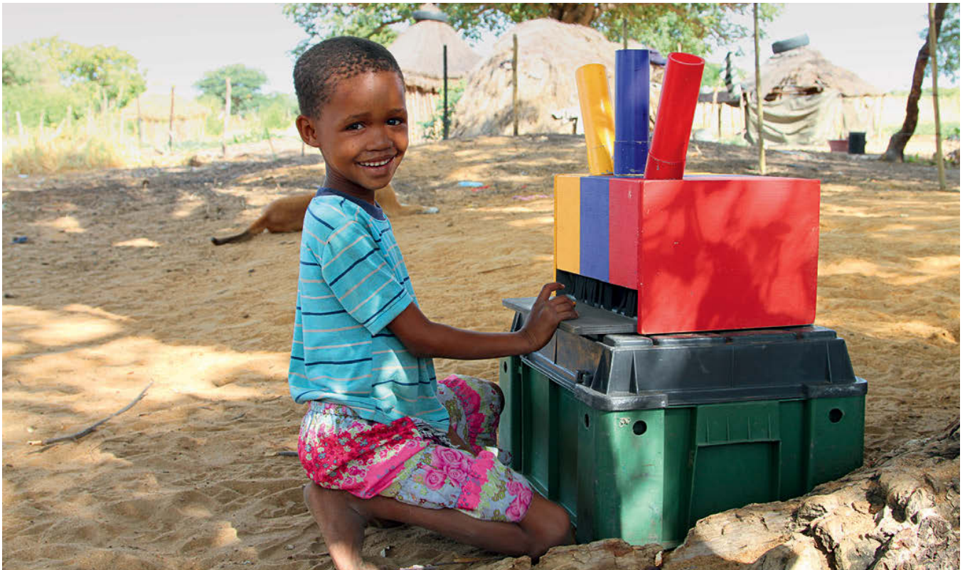
Außerhalb westlicher Normen: Ein Mädchen aus der Volksgruppe der #Akhoe Hai//om in Namibia beteiligt sich an einer psychologischen Studie.