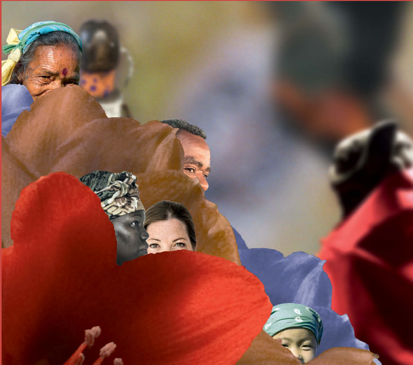
ILLUSTRATION: REGINA MARIA MÖLLER, VG BILD-KUNST BONN. WWW.REGINAMOELLER.NET