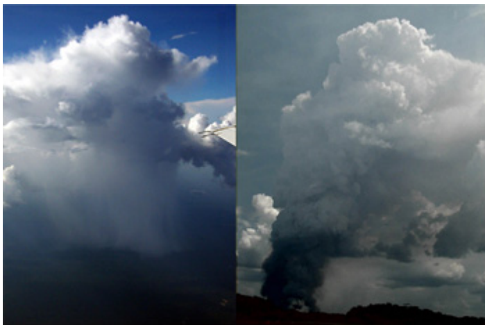
Abb. 1: Nicht jede dicke Wolke bringt Regen: In unbelasteter Luft regnet diese Wolke über dem Amazonas normal ab (links). Aus einer anderen Wolke vom selben Tag fiel kein Regen, da sie mit vielen Aerosolen durch Brandrodungen belastet war - die Tropfen blieben zu klein (rechts).