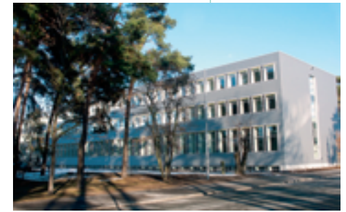
Das modernisierte Gebäude der Max-Planck-Forschungsgruppe auf dem Siemens-Forschungsgelände in Erlangen.

Die künftige Abteilung III schließlich wird sich vorrangig der Erforschung neuartiger optischer Materialien, mit Techniken zur Mikrostrukturierung derartiger Materialien sowie mit den physikalischen Eigenschaften von räumlich stark begrenztem Licht widmen. ●