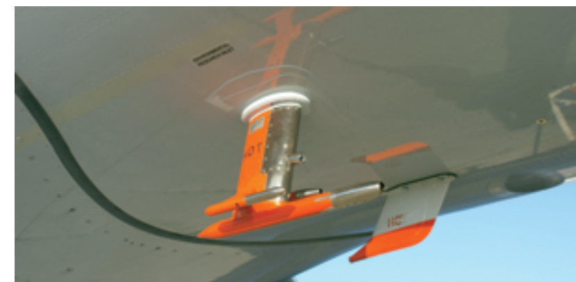
Spürröhre am Flugzeugrumpf: Durch das Einlasssystem gelangen Luft- und Aerosolproben in den Container mit den wissenschaftlichen Instrumenten.

CARIBIC bietet den Forschern hierbei einzigartige Möglichkeiten. So fliegt die Leverkusen auch in Bereichen, in denen es bislang sehr wenige oder gar keine Messungen gab. Dabei treten interessante Aspekte zu Tage: Die Mainzer Forscher konnten genau verfolgen, wie Industrie- und Autoabgase aus besonders belasteten Gebieten – etwa in China oder Indien – in große Höhen aufsteigen und bis in den Mittelmeerraum vordringen. „Das sahen wir auf