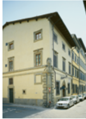
In neuem Glanz erstrahlt die Casa Zuccari nach der Renovierung. Oben die Ansicht von der Straßenseite, rechts der Blick auf die Loggia im Innenhof.