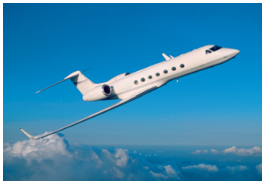
Atmosphärenforschung in großen Höhen und auf höchstem Niveau: das neue Forschungsflugzeug HALO.

Den deutschen Atmosphärenforschern wird es den Sprung in völlig neue Dimensionen erlauben: Im Deutschen Zentrum für Luft- und Raumfahrt (DLR) warfen sie und zahlreiche Gäste kürzlich im Rahmen einer Begrüßungsveranstaltung einen ersten Blick auf das künftige hochmoderne Höhenforschungsflugzeug HALO. Als so genanntes Green Aircraft war die Gulfstream G 550 zuvor in Oberpfaffenhofen gelandet und vor den Hangar des DLR gerollt. Vom Jahr 2009 an wird der modifizierte Businessjet als neues Mitglied der DLR-Flugzeugflotte zu Messflügen rund um den Globus starten – auch im Dienste der Max-Planck-Gesellschaft.