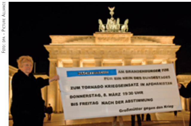
Alte Menschen sind politisch durchaus aktiv – auch wenn es um andere Themen als die Rente geht.

In den heutigen Befürchtungen über die künftige Politik alternder Gesellschaften lassen sich die Spuren einer Rhetorik wiederfinden, die schon in den politischen Diskussionen der Vergangenheit über den modernen Wohlfahrtsstaat präsent war: Die Befürchtung einer Nutzung der politischen Demokratie zur Selbstbereicherung einer parasitären Mehrheitsklasse, mit der Folge einer Strangulation der Marktwirtschaft und der Wachstumsdynamik des Kapitalismus durch eine Klasse von Rentiers, die ihren Lebensunterhalt nicht ehrlich am Markt verdient haben. In dieser Perspektive geht es denn auch in erster Linie gar nicht um Alte, sondern um Rentner: nicht um die Interessen alter Menschen als solche, sondern um die Auswirkungen ihrer sozialstaatlichen Alimentation auf die politische Ökonomie.