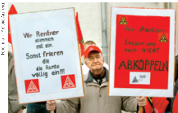
Gewerkschaften suchen die Unterstützung der Rentner, wollen aber gleichzeitig deren Mitsprache begrenzen.

Was bedeutet die Überalterung beziehungsweise Unterjüngung der großen politischen Mitgliederorganisationen für deren Politik und damit für die Politik der alternden Gesellschaft? Eine Vorschau bieten die schon heute beobachtbaren Probleme der Gewerkschaften. Der Tradition der Gewerkschaften entspricht, dass ihre Mitglieder auch nach Eintritt in den Ruhestand ihre Mitgliedschaft nicht