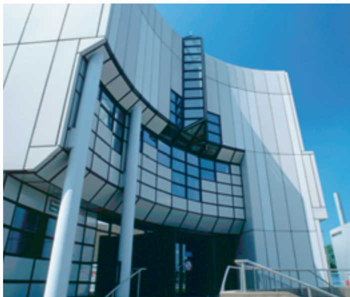
Am Max Planck Graduate Center in Mainz beteiligt: das Max-Planck-Institut für Chemie.