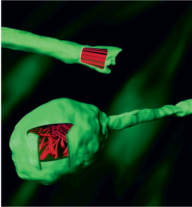
Ein verletztes Axon mit geordneten Mikrotubuli wächst weiter (oben) – anders als eines mit durcheinandergerateten Zellknochen (unten).

Krebsmedikament zeigt unverhoffte Wirkung