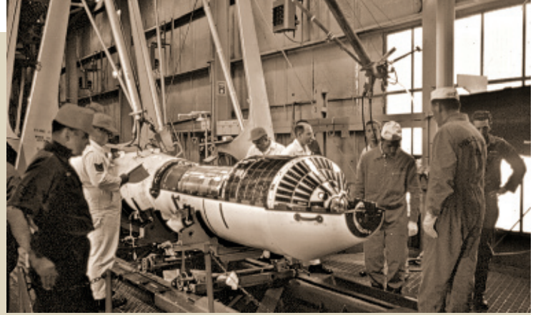
Deutsch-amerikanische Zusammenarbeit: Die Techniker montieren AZUR auf eine US-Trägerrakete.

des späteren renommierten Deutschen Raumfahrt-Kontrollzentrums in Oberpfaffenhofen südwestlich von München.